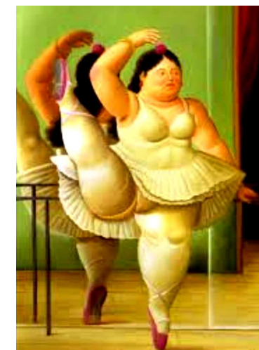
"Ballerina alla sbarra" di F. Botero

Centro Regionale ASPIC EMILIA-ROMAGNA BOLOGNA